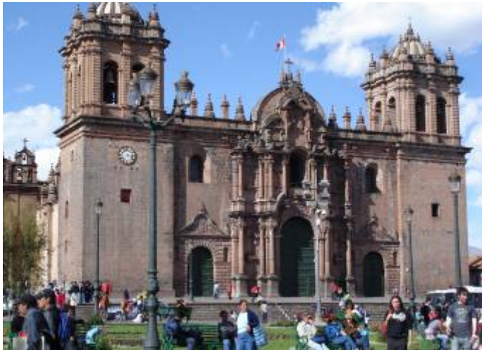
Cathédrale de CUZCO

A côté de notre action de solidarité au sein des crèches de l'association CRECHE D'AREQUIPA, nous avons eu la chance de découvrir certains sites incontournables du Pérou. Ces lieux, dont les noms à eux seuls font rêver (Machu Picchu, Lac Titicaca...), sont l'héritage des civilisations qui se sont succédé dans ce pays. Les conquistadors espagnols y ont également laissé leur empreinte, comme en témoignent les différents monuments édifiés à Lima et Arequipa (cathédrales, places d'armes, couvents, maisons coloniales, hôtels particuliers).