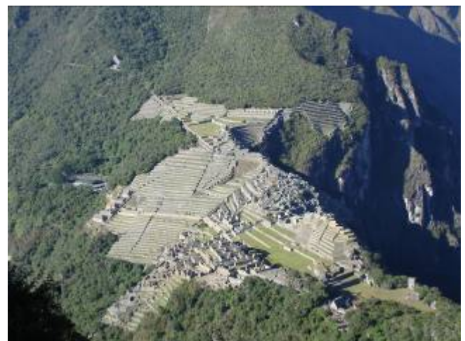
Cité inca du MACHU PICCHU

Se rendre jusqu'au Machu Picchu n'est pas chose évidente. Les touristes sont extrêmement nombreux durant la période estivale et seule une ligne ferroviaire dessert la ville d'Agua Calientes, dans la vallée au pied du Machu Picchu. Billets de train en main, nous étions toutes excitées de pouvoir enfin nous rendre sur ce site si célèbre. Perchée sur les hauteurs de la cordillère des Andes à 2350m, cette cité inca de 35hectares est aujourd'hui en ruine. Oubliée pendant des siècles, elle fut dévoilée au monde en 1911 par l'archéologue américain Hiram Bingham. Fort de son succès, le site a été désigné le 7 juillet 2007 comme l'une des sept nouvelles merveilles du monde par un organisme non officiel, ce qui fait quand même la fierté des péruviens.