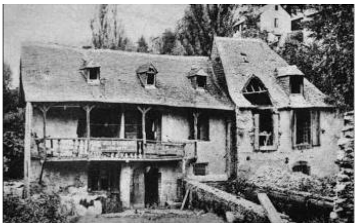
Le moulin de Boly où naquit Bernadette le 7 janvier 1844 44

Pourquoi Lourdes attire t'elle autant de monde? Est-ce cette gamine souffreteuse et illettrée qui ne connaît bien que son chapelet et quelques réponses aux questions de son catéchisme qui aurait mystifié les gens de son époque et continuerait depuis cent cinquante ans à attirer des millions de gens ? Etait-ce une vedette, un personnage si influent ?