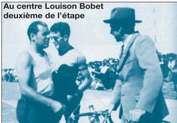
Au centre Louison Bobet deuxième de l'étape

du Tour de France à Quéven, le 10 juillet. Par précaution, M. le Maire a pris un arrêté municipal interdisant la divagation des chiens. Le Tour, né en 1903, a traversé le territoire communal pour la première fois en 1906, lors de l'étape Nantes-Brest, gagnée au sprint par Trousselier devant Pottier, le garçon-boucher de Sens. Les rois de la «petite reine» sillonnent à nouveau nos routes poudreuses vers Quimperlé en 1911. Cette année-là, le Tour compte 15 étapes pour 5500 kilomètres. Le «Morbihanais» du 26 juillet se fait l'écho enthousiaste de ce passage: