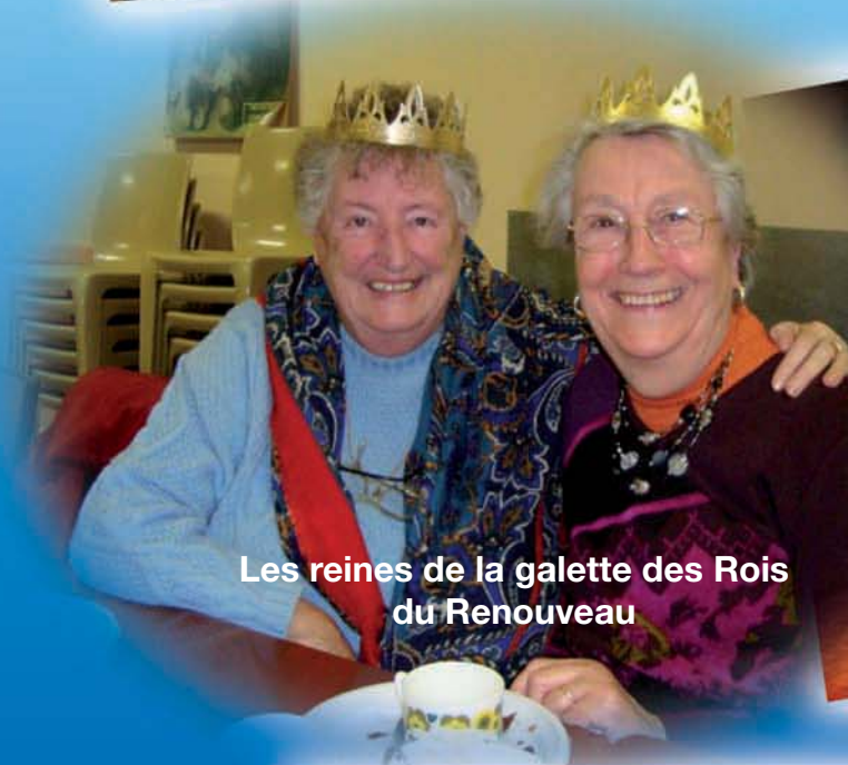
Les reines de la galette des Rois du Renouveau