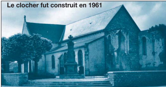
Le clocher fut construit en 1961