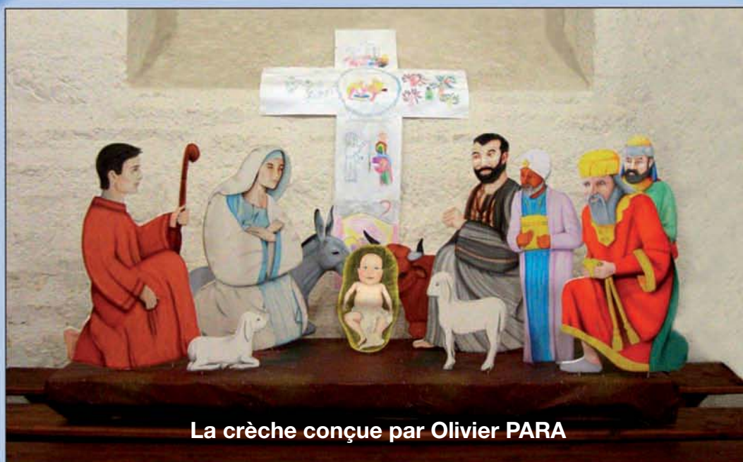
La crèche conçue par Olivier PARA