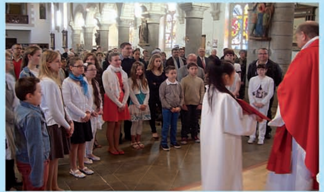
11 mai 2014 Confirmations