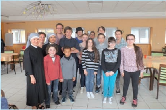
7 mai 2014 Petites sœurs des pauvres