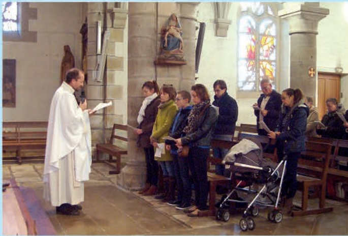
Entrée au catéchuménat des futurs baptisés