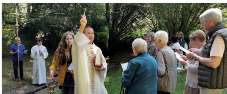
Pardon de la Trinité avec la bénédiction de l'eau à la fontaine...