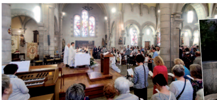
11 enfants de notre paroisse ont communiqué pour la 1 ère fois.