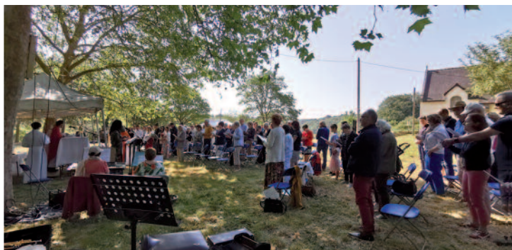
La Pentecôte a été joyeusement célébrée à Notre Dame de Bon Secours.