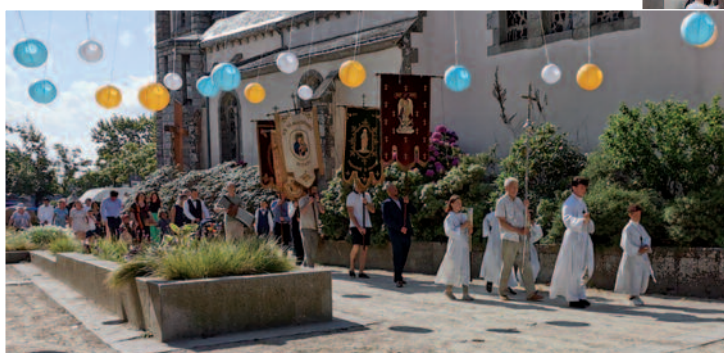
Messe d'action de grâce pour la fin d'année pastorale...