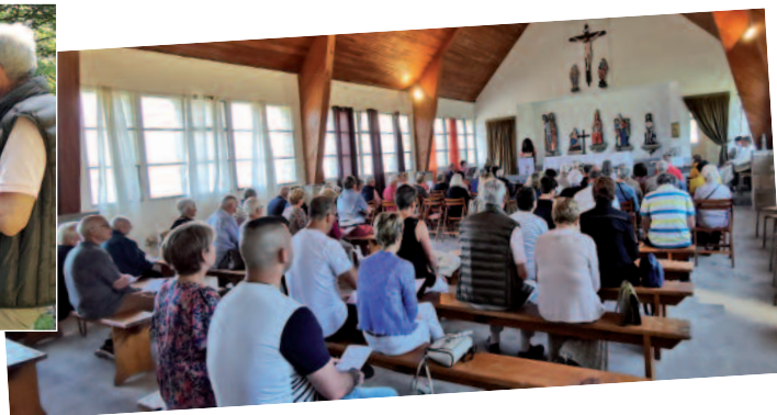
...suivie de la messe à la chapelle.