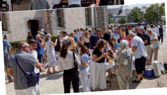
...suivie du pot de l'amitié.