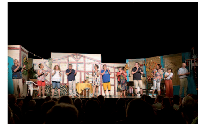
"Venez donc diner ce soir", organisé par les 3 chapelles