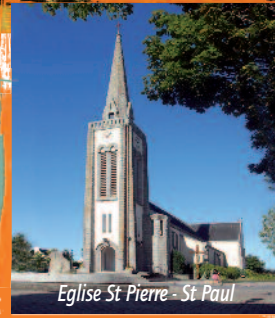
Eglise St Pierre - St Paul