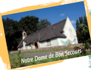
Notre Dame de Bon Secours