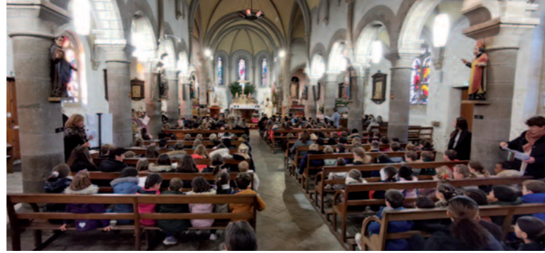
...avec les enfants de l'école St Joseph